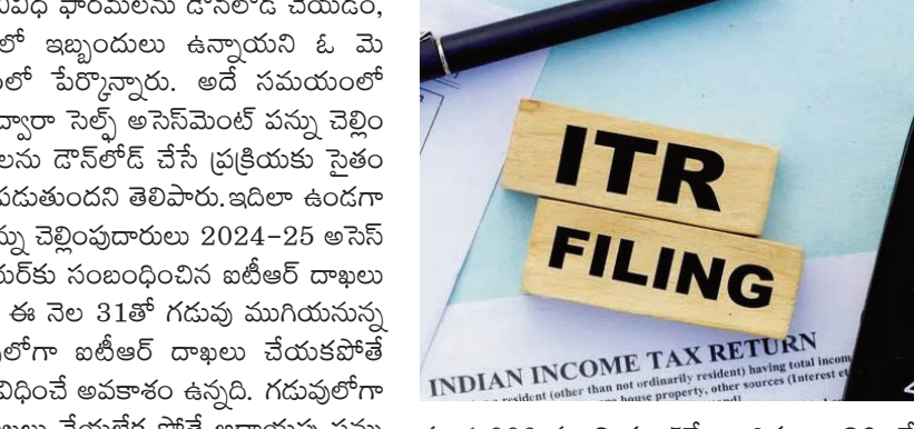
రూ. 1,000 నుంచి రూ. 5వేల జరిమానా విధించే ఛార్జ్ ఉంది. అంతే కాకుండా పలు తగ్గింపులు, మినహాయింపులను క్లెయిమ్ కోల్పోయే ప్రమాదం ఉంటుంది.