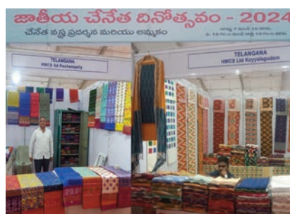
చేనేత వస్త్ర ప్రదర్శన ముందు అంబేద్కర్

విశ్వంభర, హైదరాబాద్ (నెక్స్ట్ రోడ్): చేనేత దినోత్సవం పురస్కరించుకొని హైదరాబాద్ మహానగరంలోని నెక్స్ట్ రోడ్ లో ఉన్న పీపుల్స్ ప్రాజెక్ట్ కేసెల్ 7న ప్రారంభించిన చేనేత వస్త్ర ప్రదర్శన ప్రజలను ఎంతో ఆకట్టుకుంటున్నది.