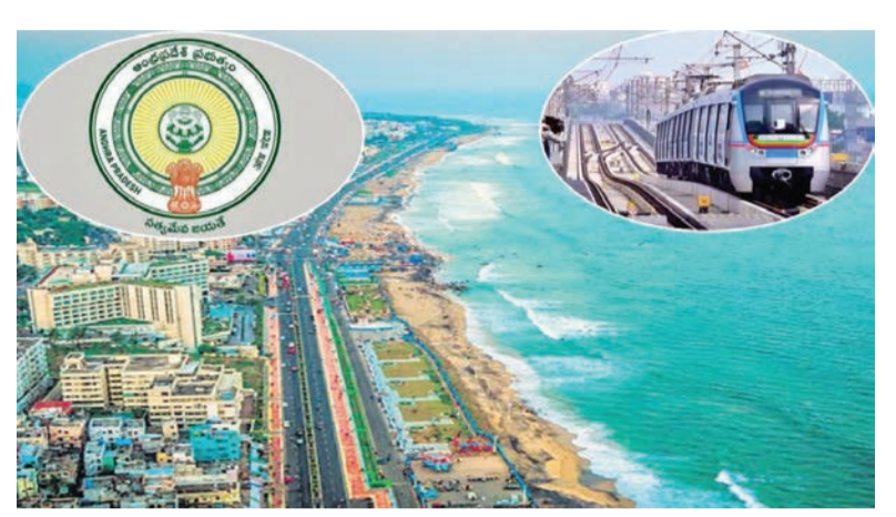
రెండో దశలో నిర్మించే మూడో కారిడార్ ను 27.5 కిలోమీటర్ల మేర నిర్మించాలని నిర్ణయించారు. విజయవాడ, విశాఖ మెట్రోరైల్ డీపీఆర్ లను కేంద్రానికి పంపాలని రాష్ట్ర ప్రభుత్వం నిర్ణయించింది.

లని ప్రభుత్వం భావిస్తోంది. మొదటి దశలో రెండు కారిడార్లు, రెండో దశలో మరో కారిడార్ నిర్మాణం చేపట్టేలా ప్రణాళికలు రూపొందించారు. మొదటి దశలో కారిడార్ 1 ఏగా గన్నవరం నుంచి పండిట్ నెహ్రూ బస్టాండ్ వరకూ, కారిడార్ 1 బిగా పండిట్ నెహ్రూ బస్టాండ్ నుంచి పెనమలూరు వరకూ మెట్రోరైల్ ప్రాజెక్టు చేపట్టనున్నారు. ఇక రెండో దశలో కారిడార్ 3గా పండిట్ నెహ్రూ బస్టాండ్ నుంచి అమరావతి వరకూ ప్రాజెక్టు నిర్మించాలని నిర్ణయించారు. మొదటి దశ కారిడార్ 1ఏ, 1బి లను 38.4 కిలోమీటర్ల మేర నిర్మించాలని డీపీఆర్ లో ప్రతిపాదించారు. దీనికి రూ.11,009 కోట్లు వ్యయం అవుతుందని ప్రభుత్వం అంచనా వేసింది. మొదటి దశ కారిడార్ 1ఏ, 1బిల భూ-సేకరణకు రూ.1152 కోట్ల వ్యయం రాష్ట్ర ప్రభు-త్వం భరిస్తుందని డీపీఆర్ లో స్పష్టం చేశారు. ఇక