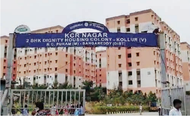
యోగదారుల స్వయంగా డబ్బులు కూడా పట్టుకుని రిఫుష్ చేయమన్నారు అది పేదవారికి భారంగా మారుతుందని వారు ఆవేదన వ్యక్తం చేశారు. అదే సమయంలో జిపావ్ ఎంపీ అధికారులు డిసెంబర్ 15 వరకు డబుల్ బెడ్ రూమ్ లబ్ధిదారులు గడువులో చేరకపోతే పట్టాలు రద్దు చేస్తామని జిపావ్ ఎంపీ అధికారులు వేరే వారికి డబుల్ బెడ్ రూమ్ లను కట్టించమని హెచ్చరికలు జారీ చేసారని ఆవేదన వ్యక్తం చేశారు.

విశ్వంభర, సంగారెడ్డి : పటాన్ చేరు నియోజకవర్గం తెల్లపూర్ మున్సిపాలిటీ పరిధిలో కొల్లూర్ డబుల్ బెడ్ రూమ్ ఇండ్లలో మౌలిక సదుపాయాలు మెరుగుపరచాలని ప్రభుత్వం కల్పించుకొని అన్ని రకాల సౌకర్యాలు కల్పించాలని, డబుల్ బెడ్ రూమ్ లకు చేరే గడువును మరో మూడు నెలలకు పొడిగించాలని లబ్ధిదారులు ఆదివారం మధ్యాహ్నం మీడియా సమావేశం ఏర్పాటు చేశారు. తెల్లపూర్ మున్సిపాలిటీ పరిధిలో కొల్లూరులో గత బి.ఆర్.ఎస్ ప్రభుత్వం హయాంలో నిర్మించిన డబుల్ బెడ్ రూమ్ లు 117 బ్లాక్కు 1489.29 కోట్ల వ్యయంతో నిర్మించిన ఇళ్లను లబ్ధిదారులకు ఒకే చోట ఏకంగా 15,660 ఇండ్ల నిర్మాణాన్ని టిఆర్ఎస్ పార్టీ మాజీ ముఖ్యమంత్రి కెసిఆర్ అందించారని కానీ అందులో మంబీటి సమస్య తీర్చాలి ఉండని వాటన్నిటిని విని