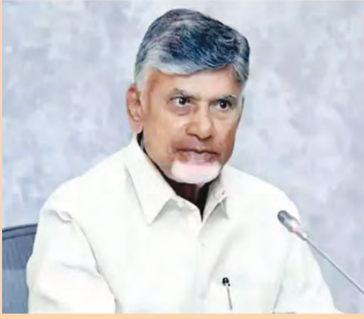
విశ్వంభర, అమరావతి: గ్రీన్ ఎనర్జీ రంగంలో రూ.10 లక్షల కోట్ల పెట్టుబడులు రానున్నాయని ఏపీ సీఎం చంద్రబాబు తెలిపారు.

కానుందని తెలిపారు. ఈ హైడ్రోజన్తో ఎరువులు, రసాయనాలు తయారవుతాయని పేర్కొన్నారు. హరిత ఇంధనం ద్వారా తయారయ్యే వీటికి విదేశాల్లో మంచి డిమాండ్ ఉందని చెప్పారు. అల్యూమినియం, ఉక్కు ఉత్పత్తికి హైడ్రోజన్ వాడితే వేడి బాగా తగ్గుతుందని వివరించారు. "గ్రీన్ కో కంపెనీ కాకినాడలో నాగార్జున ఫెర్టిలైజర్స్ను బేకోవర్ చేయనుంది. ఇక్కడ గ్రీన్ ఆమె నియమాల తయారీ చేసే విధానాలకు ఎగుమతి చేస్తారు. ఈ ఫ్యాంట్ల పై రూ.25 వేల కోట్ల పెట్టుబడులు పెడుతున్నారు. రిలయన్స్ కంపెనీ బయో కంప్రెస్డ్ గ్యాస్ తయారీకి 500 కేంద్రాలు పెడుతోంది. ఒక్కో కేంద్రానికి రూ.130 కోట్లు పెట్టుబడి పెడుతున్నారు. బయోగ్యాస్కు ఉపయోగపడే గడ్డి ద్వారా ఇది తయారవుతుంది. గడ్డి పెంచడానికి ఎకరాకు రూ.30 వేల కోలు రైతులకు రిలయన్స్ చెల్లింపనుంది. బెంగళూరు సంస్థ స్వామింగ్ బ్యాటరీల మోడల్ను కుప్పానికి తెచ్చింది. సూర్యభరణ్ అమలులో ఉన్న ఇళ్ల యజమానులకు స్వామింగ్ బ్యాటరీల ఛార్జింగ్ కు డబ్బు చెల్లిస్తారు. దీంతో వారికి అదనపు ఆదాయం వేకూనుంది. సౌర విద్యుత్ ఉత్పత్తిపై కొత్త ఆలోచనలు చేస్తున్నాం. ఎస్సీ, ఎస్టీలకు ప్రస్తుతం సౌర ఫలకాలు ఉచితంగా ఏర్పాటు చేస్తున్నాం" అని చంద్రబాబు తెలిపారు.