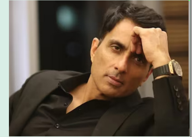
కష్టం పచ్చినా వెంటనే స్పందించి రియల్ హీరో అనిపించుకున్న విషయం తెలిసిందే. ఎంతోమంది సాయం చేసి ఆదుకున్నారాయన.

నిన్న 52వ బర్త్ డే సందర్భంగా సోనూసూద్ కీలక నిర్ణయం వ్యధాత్రమాన్ని ఏర్పాటు చేస్తున్నట్లు ప్రకటించిన నటుడు 500 మంది వృద్ధులకు ఇందులో ఆశ్రయం కల్పించనున్నట్లు వెల్లడి నటుడు సోనూసూద్ మరోసారి గొప్ప మనసు చాటుకున్నారు. నిన్న తన 52వ పుట్టినరోజు జరుపుకున్నారు. ఈ సందర్భంగా ఆయన మరోగొప్ప కార్యక్రమానికి శ్రీకారం చుట్టారు. వృద్ధులకు ఏర్పాటు చేస్తున్నట్లు ప్రకటించారు. 500 మంది వృద్ధులకు ఇందులో ఆశ్రయం కల్పించనున్నట్లు తెలిపారు. ఎవరూ లేని వృద్ధులకు సురక్షితమైన వాతావరణాన్ని సృష్టించేందుకు ఈ ప్రయత్నమని ఆయన పేర్కొన్నారు. ఇందులో వృద్ధులకు ఆశ్రయం ఇవ్వడంతో పాటు వైద్య సంరక్షణ, పోషకాహారం కూడా అందించనున్నట్లు తెలిపారు. దీంతో ఈ రియల్ హీరోపై మరోసారి ప్రశంసలు వెల్లువెత్తుతున్నాయి. కాగా, సోనూసూద్ మహమ్మారి కరోనా సమయంలో దేశంలో ఏ