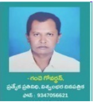
- గంధే గోపర్షన్

కొనేవాడే భరించాలి, మొయ్యాలి. అయితే పెంచిన ఆ 25 శాతం అదనపు ధరతో భారతీయ వస్తువులను ఎందుకు కొంటారు? ఎందుకు కొనాలి? అమెరికాకు దిగుమతి అయ్యే ఆ భారతీయ వస్తువుకు మరో ప్రత్యామ్నాయ వస్తువును అమెరికన్ వినియోగదారులు ఎంచుకుంటారు కదా. అప్పుడు భారతీయ వస్తువుల డిమాండ్ అమెరికాలో పడిపోతుంది. అంతే అమెరికా ఎగమతి పరిమాణం తగ్గిపోతుంది. అప్పుడు అనివార్యంగా ఆ వస్తువుల ఉత్పాదక పరిమాణం ఇండియన్ పరిశ్రమ తగ్గించవలసి వస్తుంది. అప్పుడు ఆ పరిశ్రమ కొంత సంక్షోభంలో పడి పోతుంది. దానిలో పనిచేసే కొందరు కార్మికులకు ఉపాధి దెబ్బ తింటుంది. ఫలితంగా భారత ఆర్థిక వ్యవస్థ కొంత ఇబ్బంది పడిపోతుంది. ఇది అంతా కామన్ సెన్సె కు సంబంధించిన అతి చిన్న అంశమే కదా. కానీ మన మట్టి బుర్రల మూకక మాత్రం ఇది అర్థం కావటం లేదు.