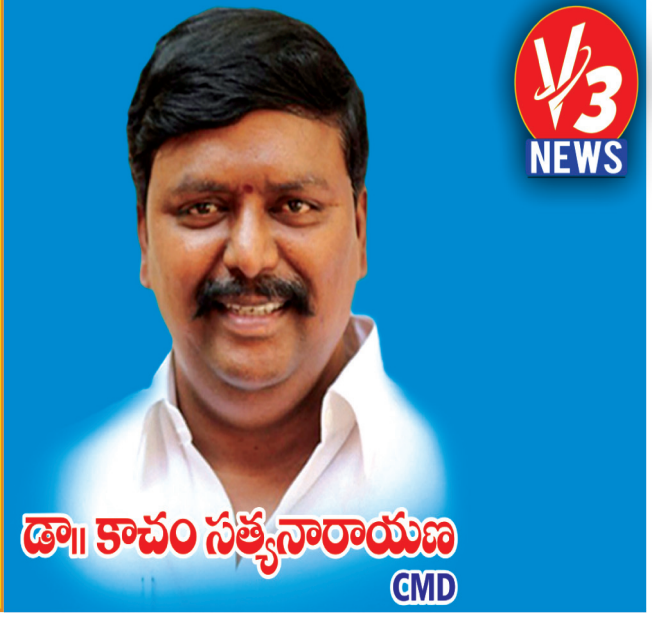
డా. కాంచం సత్యనారాయణ GMD