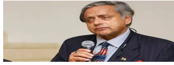
న్యాయం. ఇప్పటికే భారత్ పై 25శాతం సుంకాలు విధించిన ట్రంప్ దాన్ని 50శాతానికి పెంచారు. అంతకుముందు ప్రకటించిన పాత 25శాతం సుంకాలు గురువారం నుంచి అమెరికాకి వచ్చాయి. కొత్తగా విధించిన 25శాతం టారిఫ్స్ లు ఈనెల 27 నుంచి అమెరికాకి రానున్నాయి. భారతీయ వస్త్ర పరిశ్రమ, ఆక్సా రంగం, తోలు ఉత్పత్తులపై ఇది వెంటనే ప్రభావం చూపనుంది. ట్రంప్ విధించిన సుంకాలపై ప్రధాని మోడీ మాట్లాడుతూ.. రైతుల ప్రయోజనాలపై ఎన్నటికీ రాజీపడే ప్రసక్తి లేదన్నారు. రైతుల ప్రయోజనాలను కాపాడటం కోసం వ్యక్తిగతంగా ఎంత చెల్లించేందుకైనా సిద్ధంగా ఉన్నట్లు తెలిపారు.

విశ్వంభర, నేషనల్ బ్యూరో: రష్యా నుంచి చమురు కొనుగోలు చేస్తున్నారనే కారణంతో భారత్ పై అమెరికా అధ్యక్షుడు డొనాల్డ్ ట్రంప్ 50శాతం సుంకాలు విధించడాన్ని కాంగ్రెస్ ఎంపీ శశిధరూర్ తీవ్రంగా తప్పుబట్టారు. అమెరికా దిగుమతులపై కూడా భారత ప్రభుత్వం అలాంటి చర్యలే తీసుకోవాలన్నారు. గురువారం పార్లమెంటు వెలుపల ఆయన మీడియాతో మాట్లాడారు. అమెరికా విధించిన సుంకాలు మనపై కచ్చితంగా ప్రభావం చూపిస్తాయన్నారు. దాదాపు 90 బిలియన్ డాలర్ల మేర ఎగుమతులు జరుగుతున్నాయన్నారు. సుంకం ఎక్కువగా ఉన్నప్పుడు భారత్ వస్తువులు ఎందుకు కొనాలి అని కొనుగోలుదారులు కూడా ఆలోచిస్తారన్నారు. రష్యా నుంచి భారత్ కంటే చైనా ఎక్కువ చమురు కొనుగోలు చేస్తోందని.. కానీ, ఆ దేశానికి ట్రంప్ సుంకాలు నుంచి 90 శాతం ఉపశమనం కల్పించారన్నారు. మనకు మాత్రం మూడు వారాలే ఉపశమనం కల్పించడం సమంజసం కాదన్నారు. కేంద్రం కూడా యూఎస్ దిగుమతులపై 50శాతం సుంకం విధించాలని కోరారు. మరే దేశం కూడా మనపై ఇలా బెదిరింపులకు దిగకూడద