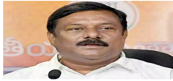
సోనియా వల్లే కాలేదు.. ఇక రేవంత్ రెడ్డి సామర్థ్యం ఎంతో చూసుకోవాలని చెప్పారు. అంతేకాదు.. ఈ జన్మలో రాహుల్ గాంధీ ప్రధాని కాలేదని ఘాటు వ్యాఖ్యలు చేశారు.