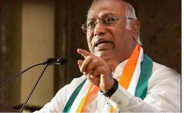
వ్యక్తం చేశారు. భారత్ దిగుమతులపై ఇప్పటికే 25% సుంకాలను విధించిన ట్రంప్ .. దానిని 50 శాతానికి పెంచిన సంగతి తెలిసిందే. దీనిపై ప్రధాని మోడీ పరోక్షంగా స్పందించారు. “రైతుల ప్రయోజనాలపై ఎన్నటికీ రాజీపడే ప్రసక్తి లేదంటూ అమెరికాను ఉద్దేశపూర్వకంగా గద్దె బదులిచ్చారు.

విశ్వంభర, నేషనల్ బ్యూరో: అమెరికా అధ్యక్షుడు డొనాల్డ్ ట్రంప్ మన దేశంపై సుంకాల మోత మోగించారు. ఇదంతా ప్రధాని నరేంద్రమోడీ అనుసరిస్తానని విదేశాంగ విధానం వైఖరిపై వల్లేసని కాంగ్రెస్ అధ్యక్షుడు మల్లికార్జున్ ఖర్గే దుయ్యబట్టారు. “ ఈ వైఖరిని కుడా 70 ఏళ్లు పాలించిన కాంగ్రెస్ పార్టీ కారణమని నిందించే అవకాశం వారికి లేకుండా పోయింది” అని ఎద్దేవా చేశారు. 1971 యుద్ధంలో పాకీ మద్దతుగా అమెరికా తన సెవెంత్ ఫ్లీట్ ను బంగాళాఖాతంలోకి పంపిన విషయం తెలిసిందే. నాడు సోవియట్ మద్దతు భారత్ కు ఉండటంతో.. అమెరికా ఎత్తులు పారలేదు. అలాగే అణచివేతల తర్వాత మన దేశంపై అమెరికా అంక్షలు విధించింది. దానిని తాజాగా ఖర్గే ప్రస్తావించారు. అప్పుడు భారత ప్రభుత్వం ఆత్మగౌరవంతో యూఎన్ తో సంబంధాలను నెరిపిందన్నారు. కానీ ఇప్పుడు దౌర్భాగ్యం దారుణంగా పతనమైందని ధ్వజమెత్తారు. ఇక, 50 శాతం సుంకాలు అమెరికాకి వస్తే.. భారత ఆర్థిక వ్యవస్థపై రూ. 3.75 లక్షల కోట్ల భారం పడుతుందని అంచనా వేశారు. దీనివల్ల చిన్న పరిశ్రమలు, వ్యవసాయం, స్థానిక వస్త్ర పరిశ్రమలు దెబ్బతింటాయని ఆందోళన