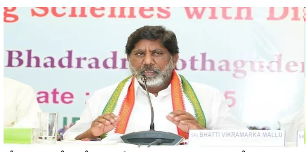
గోదావరిపై మేం చేపట్టిన ప్రాజెక్టులు ఇంకా పూర్తి కావలేదు. వరద జలాలపై ఇరు రాష్ట్రాల వాటా తేలిక తర్వాత ప్రాజెక్టులు కట్టుకుంటే న్యాయబద్ధంగా ఉంటుంది. నీటి వాటాలను తేల్చుకునే బాధ్యత కేంద్రానిది. రాజకీయ ప్రయోజనాల కంటే మాకు రాష్ట్ర ప్రయోజనాలే ముఖ్యం. మా ప్రాజెక్టుల నిర్మాణం పూర్తయిన తర్వాత మిగులు జలాలను బీ వారు కోవచ్చు. మా అవసరాలు తీరకుండా దిగువన ప్రాజెక్టుల నిర్మాణం చేపట్టే సమస్య వస్తుంది" అని భట్టి అన్నారు.

మొదటిపేజీ తరువాయి... విశ్వంభర, విశాఖ: భవిష్యత్తులో ఏపీలో కూడా కాంగ్రెస్ బలపడుతుందని, రాషన్ గాంధీ ప్రధాని అవుతారని తెలంగాణ డిప్యూటీ సీఎం భట్టి విక్రమార్క అన్నారు. విశాఖలో నిర్వహించిన 'స్టాప్ ఓట్ చోలీ' కార్యక్రమంలో ఆయన పాల్గొని మాట్లాడారు. ఈ సందర్భంగా తమ పార్టీలో నాయకులకు స్వేచ్ఛ ఉన్నట్లు వెల్లడించారు. అంతేకాని ఎలాంటి విభేదాలు లేవు అని స్పష్టం చేశారు. తెలంగాణలో కాంగ్రెస్ పటిష్టంగా ఉంది.. అసలం తప్పి అనేది కొందరు ప్రచారం చేస్తున్నారని మండిపడ్డారు తెలుగు రాష్ట్రాల మధ్య నీటి వివాదంపై స్పందించారు. ఏపీతో ఉన్న జలవివాదంపై చట్టబద్ధంగానే ముందుకు వెళితామని అన్నారు. తెలంగాణకు వాటా ఇచ్చిన తర్వాత జలాలను ఏపీ వారుకోవాలని చెప్పారు. తెలంగాణ తెచ్చుకున్నదే సరి జలాల కోసం.. బీడు భూములను సాగులోకి తెచ్చుకోవడం కోసమని, రాష్ట్రంలో ప్రాజెక్టులు పూర్తయ్యే కేటాయింపులు జరిగితే మిగులు జలాల అంశంపై చర్చలుంటాయని భట్టి స్పష్టం చేశారు. సముద్రంలోకి వెళ్ళే జలాల అని మాట్లాడటం అర్థం చేసుకోలేని అమాయకులు ఎవరూ లేరు.