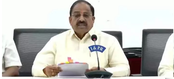
కేంద్ర ఎరువుల, రసాయనాల శాఖ మంత్రి జేపీ నర్సా, కేంద్ర మంత్రిలు కిషన్ రెడ్డి, బండి సంజయ్ లకు ఇదివరకే లేఖలు రాసి, తక్షణ చర్యలు తీసుకోవాలని కోరారు. అలాగే రామగుండం ఫెర్టిలైజర్ అండ్ కెమికల్స్ లిమిటెడ్ నుంచి స్పెషియల్ యూరియా సరఫరాను 30,800 టన్నుల నుంచి 60,000 టన్నులకు పెంచాలని, ఏప్రిల్-జూన్ మధ్య తరెత్తిన లోటును భర్తీ చేయడానికి అదనపు కోటా కేటాయించాలని కోరారు.

మొదటిపేజీ తరువాయి... విశ్వంభర, తెలంగాణ బ్యూరో: తెలంగాణలో యూరియా కొరత అంశాన్ని పార్లమెంటులో కేంద్రాన్ని గిలదీయాలని రాష్ట్ర వ్యవసాయశాఖ మంత్రి తుమ్మల నాగేశ్వరరావు అన్నారు. రాష్ట్రంలో యూరియా కొరత సమస్యను కేంద్ర ప్రభుత్వం దృష్టికి తీసుకెళ్లాలని రాష్ట్ర ఎంపీలను కోరారు. ఈ విషయం ఖరీద్ సీజన్ లో రైతులు తీవ్ర యూరియా కొరతను ఎదుర్కొంటున్న సేవల్లో.. ఈ అంశాన్ని పార్లమెంటులో తీసుకెళ్లాలని ప్రకారం పార్లమెంటులో యూరియా సరఫరా జరిగేలా చర్యలు తీసుకోవాలని ఆయన సూచించారు. 2024-25 సంవత్సరానికి తెలంగాణకు కేంద్రం 9.80 లక్షల మెట్రిక్ టన్నుల యూరియా కేటాయింపగా, జూలై 31 నాటికి కేవలం 4.36 లక్షల టన్నులు మాత్రమే సరఫరా అయింది. దీంతో ఏడాదికి ఇంకా 2.24 లక్షల టన్నుల కొరత ఏర్పడింది. ఆగస్టు నెలలో 3.50 లక్షల టన్నుల అవసరం ఉండగా, కేవలం 1.70 లక్షల టన్నులు మాత్రమే సరఫరా కావడంతో రైతులు, ముఖ్యంగా పత్తి, మొక్కజొన్న, వరి పంటలు సాగు చేసే వారు తీవ్ర ఇబ్బందులు ఎదుర్కొంటున్నారు. అయితే ఈ సమస్యను పరిష్కరించాలని మంత్రి తుమ్మల