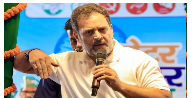
వ్యవహారంలో ప్రతిపక్షాల ఆరోపణలను అంతకుముందు ఎన్నికల సంఘం ఖండించిన విషయం తెలిసిందే. ఈసీకి లాంటి భేదభావలు ఉండవని, అన్ని పార్టీలను సమానంగా చూస్తుందని కేంద్ర ఎన్నికల సంఘం కమిషనర్ జ్ఞానేశ్ కుమార్ పేర్కొన్నారు. ఓటు చోరీ పేరుతో కొందరు అసవరణ అసమానాలు లేవనెత్తుతున్నారని ఆక్షేపించారు. రాజ్యాంగ సంస్థలను అవమానించడం సరికాదన్నారు. 'ఓట్ల చోరీ' ఆరోపణలపై రాహుల్ గాంధీ వారం రోజుల్లోపు అఫిడవిట్ సమర్పించాలని, లేనివకల్లో వాటిని నిరాధారమైనవిగా పరిగణిస్తామని స్పష్టం చేశారు.

మొదటిపేజీ తరువాయి... విశ్వంభర, నేషనల్ బ్యూరో: బిహార్ లో ఓట్ల చోరీకి 'ఓటర్ జాబితా ప్రత్యేక సమగ్ర పరచణ' మార్గమని కాంగ్రెస్ అగ్రనేత రాహుల్ గాంధీ ఆరోపించారు. ఎన్నికల సంఘం పై ఎటువంటి చర్యలకు అవకాశం లేకుండా 2023లో కేంద్రం ఓ చట్టం తీసుకొచ్చిందని, ప్రధాని మోడీ-అమిత్ షాకు ఈ సీ సాయం చేస్తున్నారనే ఇలా చేసిందని ఆరోపించారు. ఓటర్ జాబితా అవకాశం విషయంలో ప్రతిపక్షాల ఆరోపణలపై ఎన్నికల సంఘం మీడియా సమావేశం నిర్వహించిన అనంతరం ఆయన ఈ మేరకు వ్యాఖ్యానించారు. "ఈ రోజు ఎన్నికల సంఘం ఓ సమావేశం నిర్వహించింది. అయితే.. ఎన్నికల ప్రక్రియకు సంబంధించిన సీసీ ఫుట్ జీల్ విషయంలో ప్రభుత్వం పట్టణం మార్చింది? అదేమిదా? ఎన్నికల కమిషన్ పై ఎటువంటి కేసు నమోదు చేసినందుకు వీలేకుండా 2023లో చట్టం చేసింది. ప్రధాని మోడీ, అమిత్ షాకు ఈ సీ సాయం చేయడంతోపాటు ఓట్ల చోరీలో పాలుపంచుకుంటున్నందుకు ఎవరూ చర్యలు తీసుకోకూడదనే దీన్ని రూపొందించింది" అని రాహుల్ గాంధీ ఆరోపించారు. బిహార్ లో 'ఓటర్ అధికార యాక్ట్' తొలిరోజు ముగింపు సభలో ప్రసంగిస్తూ.. రాజ్యాంగాన్ని, 'ఒక వ్యక్తి - ఒక ఓటు' నూత్రాన్ని కాపాడుకునేందుకు పోరాటం చేస్తున్నట్లు తెలిపారు. ఓటర్ జాబితా