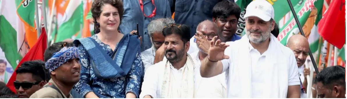
బీహార్ రాష్ట్రం సుపాల్ లో లోక్ సభలో విపక్ష నేత రాహుల్ గాంధీ, కాంగ్రెస్ జాతీయ ప్రధాన కార్యదర్శి ప్రయాంత్ గాంధీలతో కలిసి ఓటర్ అధికార యాత్రలో పాల్గొన్న ముఖ్యమంత్రి రేవంత్ రెడ్డి.

ఆపరేషన్ సిందూర్ నుంచి నేర్చుకున్న పాఠాలతో ఆధునిక ఘర్షణలను ఎదుర్కోవడానికి భారత్ సమాయత్తమవుతుందని అనిల్ చౌహాన్ తెలిపారు. ఇందుకోసం త్రివిధ దళాలు కలిసి పనిచేస్తున్నారన్నారు. మనపై దాడి చేస్తే దాని ప్రభావం ఎలా ఉంటుందో ఆపరేషన్ సిందూర్ సమయంలో ప్రపంచం మొత్తం చూసినందు పేర్కొన్నారు. ఆపరేషన్ సిందూర్ అప్పుడే అయిపోలేదని, ఎప్పుడీకీ కొనసాగుతుందన్నారు. రక్షణ వ్యవస్థలను, ఆయుధశక్తిని మరింత బలవంతం చేసుకునేందుకు కేంద్ర ప్రభుత్వం చర్యలు తీసుకుంటున్నట్లు తెలిపారు. భారత్ అభివృద్ధి చెందిన దేశాల సరసన నిలబడాలంటే 'శకాస్త్ర'.. 'సురక్షిత'.. 'అత్యనిర్భయ'గా మారడం ఎంత అవసరమో ప్రజల సైద్ధాంతికపరమైన ఆలోచనలు.. కార్యాచరణల్లోనూ మార్పు తీసుకురావడం అంతో అవసరమని సీడీఎస్ సూచించారు. అప్పుడే భవిష్యత్తులో ఎదురయ్యే భద్రతాపరమైన సవాళ్లను వేగంగా, నిర్ణయాత్మకంగా ఎదుర్కోగలమని అన్నారు.