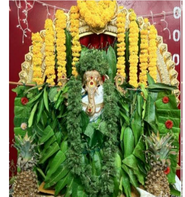
ఇది విషయకచరిత్ర ఏకవింశతి పూజలో దాగిన రహస్యం! మన ఋషీశ్వురులు చెప్పిన సూతన హైందవ ధర్మ రహస్యాలను తెలుసుకుందాం! మన ఆచారాలను పాటించి! మన హైందవ సూతన ధర్మాన్ని రక్షిద్దాం!