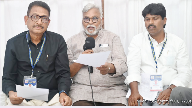
ఫుడ్ స్టాల్, టికెట్ల విక్రయాల ద్వారా వచ్చిన ఆదాయం బ్యాంకు ఖాతాల్లో ఎందుకు జమ కాలేదు? అని నిలదీశారు. సంస్థకు అధికారిక బ్యాంక్ ఖాతా ఉండగా 'ది హైదరాబాద్ బుక్ ఫెయిర్' పేరిట రిజిస్ట్రేషన్ లేకుండానే అకౌంట్ ను తెరిచి నిధులు దారిమళ్లించారని పేర్కొన్నారు. ఎస్బీఐ ఖాతా నుంచి ఒక కన్వెన్షన్ నింటర్ కు రూ. 32 లక్షలు బదిలీయించారని, రూ. 10 లక్షల సగటు