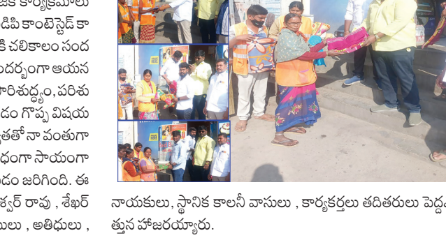
నాయకులు, స్థానిక కాలనీ వాసులు, కార్యకర్తలు తదితరులు పెద్దపత్తున హాజరయ్యారు.