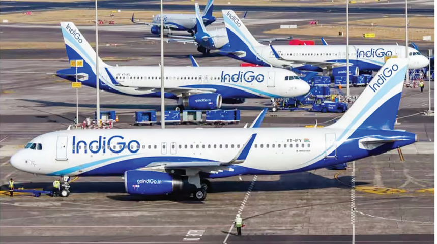
ఇక్కడ విమానం నడపడం భద్రతా నిబంధనలకు విరుద్ధమని చెప్పడంతో ప్రయాణికుల ఆగ్రహం మరింత పెరిగింది. కొంతమంది సిబ్బందితో తీవ్ర వ్యాధానికి దిగగా, పరిస్థితి

విశ్వంభర, నేషనల్ బ్యారో : ముంబై నుంచి ధాయ్ లాండ్ లోని క్రాబీ బయలుదేరాలని ఉండిగ్ విమానంలో గురువారం ఉదయం తీవ్ర ఉద్రిక్తత చోటు చేసుకుంది. ఫైలర్ తన విధి నిర్వహణ సమయం పూర్తయిందని చెబుతూ విమానాన్ని నడపడానికి నిరాకరించడంతో ఈ పరిస్థితి ఏర్పడింది. విమానం గంటల తరబడి రన్ వేపైనే నిలిచిపోవడంతో ప్రయాణికులు తీవ్ర అసహనానికి లోనయ్యారు. ఈ ఘటనకు సంబంధించిన దృశ్యాలు సోషల్ మీడియాలో వేగంగా వ్యాప్తి చెందాయి. సమాచారం ప్రకారం, ఇండిగోకు చెందిన 6E 1085 విమానం గురువారం తెల్లవారుజామున 4:05 గంటలకు ముంబై నుంచి క్రాబీకి బయలుదేరాల్సి ఉంది. అయితే, ముందుగా రావాల్సిన మరో విమానం ఆలస్యం కావడం, ఎయిర్ ట్రాఫిక్ ఎక్కువగా ఉండటం వంటి కారణాల వల్ల ఈ ఫైలర్ కు మూడు గంటలకు పైగా ఆలస్యం జరిగింది. ఆనంతరం ప్రయాణికులను విమానంలోకి ఎక్కించినప్పటికీ టోకాఫ్ కు అనుమతి లభించకపోవడంతో విమానం అక్కడికక్కడే నిలిచిపోయింది. ఇంతలో ఫైలర్ తన డ్యూటీ సమయం ముగిసిపోయిందని,