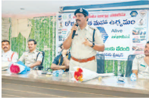
ఉద్యోగులు ప్రభుత్వం చేయాలని అవగాహన కల్పించాలని కోరారు. ప్రయాణ సమయంలో తీసుకోవాల్సిన జాగ్రత్తల పట్ల ప్రజలకు వివరించాల్సిన బాధ్యత మనపై ఉన్నదని

విశ్వంభర, సూర్యాపేట: రాష్ట్ర ప్రభుత్వం ప్రవేశపెట్టిన రోడ్డు భద్రత మహాత్మ్యవాలు, పోలీసుల ఆధ్వర్యంలో నిర్వహిస్తున్న అరెస్ట్ అ లైవ్ కార్యక్రమంలో భాగంగా సూర్యాపేట జిల్లా ఎస్పీ నరసింహ ఆదేశాల మేరకు ఈరోజు సూర్యాపేట పట్టణ మున్సిపల్ కార్యాలయంలో అవగాహన సదస్సు నిర్వహించారు ఈ కార్యక్రమంలో డిఎస్పీ ప్రసన్నకుమార్ మాట్లాడుతూ, ప్రస్తుతం రోడ్డు ప్రమాదాల పట్ల ఎక్కువగా మరణాలు సంభవిస్తున్నాయని అన్నారు. రోడ్డు ప్రమాదాలను తగ్గించడంలో ప్రభుత్వ ఉద్యోగులు బాధ్యతగా వ్యవహరించాలని సూచించారు, రోడ్డు భద్రత పట్ల సామాన్య ప్రజలను పౌరులను యువతను ప్రభుత్వ