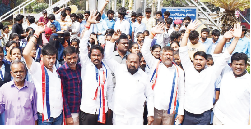
చెల్లించకపోవడంతో విద్యార్థులు అనేక ఇబ్బందులకు గురవుతున్నారని అన్నారు. ఫీజులు చెల్లించాలని కళాశాలల యాజమాన్యాలు నర్తకపాటలు ఇవ్వడం లేదని దీని వల్ల కొంతమంది ఉద్యోగాలు కోల్పోతున్నారని ఆయన ఆవేదన వ్యక్తం చేశారు. రాష్ట్ర ఆర్థిక శాఖ మంత్రి