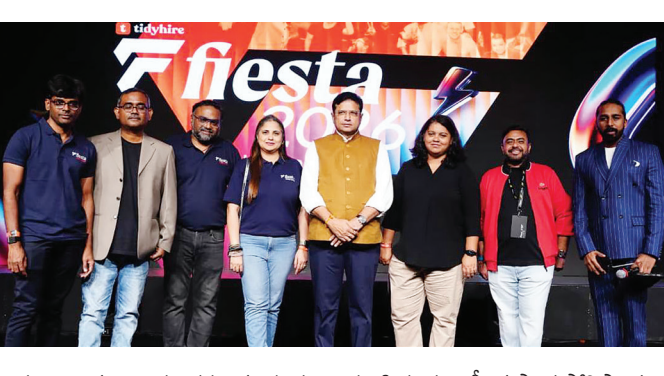
రాష్ట్రంగా కాకుండా, పరిశ్రమలకు భవిష్యత్తు భాగస్వామిగా తీర్చిదిద్దుతున్నామని తెలిపారు. విజ యూనివర్సిటీ, స్కీల్ యూనివర్సిటీ వంటి సంస్థలు కీలక పాత్ర పోషిస్తాయని పేర్కొన్నారు. ఈ కార్యక్రమంలో డి.జి. బి.కె.కె.పె.సి. ప్రతినిధులు, స్కీప్ నిర్వాహకులు పాల్గొన్నారు.