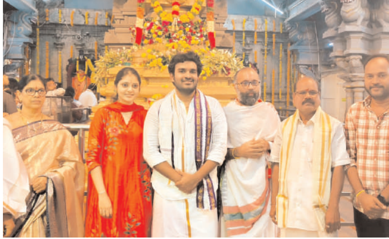
పాల్గొన్నారు. ప్రముఖ సినీ హీరో దర్శనంతో భద్రాచలం శ్రీ సీతారామచంద్ర స్వామి వారి ఆలయం సూతన సంవత్సరం మరొక ఆధ్యాత్మిక కాంతితో వెలుగొందిందని భక్తులు అభిప్రాయపడ్డారు.

భద్రాచలం క్షేత్రంలో వెలసిన ఆధ్యాత్మిక వైభవానికి ప్రతీకగా నిలిచిన శ్రీ సీతారామచంద్ర స్వామి వారిని ప్రముఖ తెలుగు సినీ హీరో కిరణ్ అబ్బవరం సూతన సంవత్సరం తొలి రోజున శ్రద్ధాభక్తులతో దర్శించుకున్నారు. ఉదయం ఆలయానికి చేరుకున్న ఆయనకు దేవస్థానం అధికారులు, అర్చకులు సంప్రదాయబద్ధంగా పూజారోజులతో స్వాగతం పలికారు. అనంతరం స్వామివారి మూలవిరాట్లను దర్శించుకుని ప్రత్యేక పూజలు నిర్వహించారు. ఈ సందర్భంగా కిరణ్ అబ్బవరం శ్రీ సీతారామచంద్ర స్వామి వారి దివ్య అనుగ్రహం తనకు, తన కుటుంబానికి, అలాగే తన సినీ ప్రయాణానికి ఎల్లప్పుడూ ఉండాలని ప్రార్థించారు. ఆలయ అర్చకులు ఆయనకు వేద ఆశీర్వాదం అందించి తీర్థప్రసాదాలు, శేషప్రసాదం ప్రసాదంగా అందజేశారు. ఆలయ ప్రాంగణంలో కొంతసేపు గడిపిన ఆయన, భద్రాచలం క్షేత్రం కలిగిన ఆధ్యాత్మిక శక్తి, ప్రశాంత వాతావరణం తన మనసుకు ఎంతో ఆనందాన్ని కలిగించిందని తెలిపారు. గోదావరి తీరంలో వెలసిన శ్రీ సీతారామచంద్ర స్వామి వారి ఆలయం భక్తుల హృదయాలలో ప్రత్యేక స్థానాన్ని సంపాదించుకుందని, ఇక్కడికి వచ్చిన ప్రతిసారి కొత్త ఉత్సాహం, ఆత్మవిశ్వాసం లభిస్తుందని కిరణ్ అబ్బవరం పేర్కొన్నారు. సినీ రంగంలో తనకు లభించిన విజయాల్ని దైవకృప ఫలితమేనని, భవిష్యత్తులో కూడా మంచి సందేశాత్మక చిత్రాలతో ప్రేక్షకుల ముందుకు రావాలని స్వామివారిని వేడుకున్నట్లు తెలిపారు. హీరో దర్శన సమాచారం తెలిసిన వెంటనే ఆలయానికి పెద్ద సంఖ్యలో భక్తులు చేరుకుని ఆయనను చూసేందుకు ఆసక్తి చూపించారు. అభిమానులతో సానుకూలంగా మాట్లాడిన కిరణ్ అబ్బవరం, భక్తుల ప్రేమాభిమానాలు తనకు మరింత ప్రోత్సాహాన్ని ఇస్తాయని అన్నారు. కార్యక్రమంలో దేవస్థానం అధికారులు, ఆలయ సిబ్బంది, భక్తులు