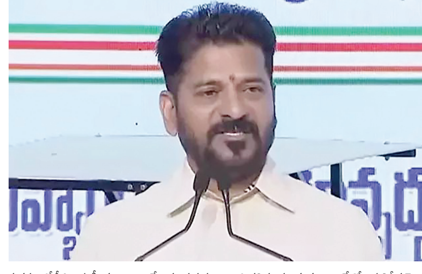
ర్యక్రమంలో సీఎం ఈ కీలక వ్యాఖ్యలు చేశారు. ప్రభుత్వ వారి తల్లిదండ్రులకు కూడా అదే రోజున నిర్ణీత మొత్తం ఉద్యోగికి ప్రతి నెల ఒకటో తేదీన జీతం ఎలా పడుతుందో, (1015%) వారి ఖాతాల్లో జమపెట్టబడుతుందన్నారు. ఈ

చట్టానికి సంబంధించిన విధివిధానాలు, నిబంధనలను రూపొందించే బాధ్యతను కొత్తగా విధుల్లో చేరుతున్న అధికారులకే అప్పగిస్తున్నట్లు సీఎం తెలిపారు. దీనిపై తక్షణమే కనరత్న చేయాలని ప్రభుత్వ ప్రధాన కార్యదర్శి ని ఆదేశించారు.