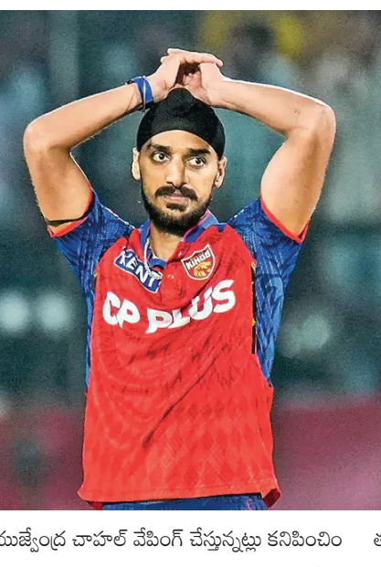
యుజ్వేంద్ర చావేల్ వేపింగ్ చేస్తున్నట్లు కనిపించి తడబడి ఫ్లై అప్స్ కు దూరమైన సంగతి తెలిసింది.

విశ్వంభర, సార్వీక్ష్ : టీమ్ ఇండియా పేసర్, పంజాబ్ కింగ్స్ ఆటగాడు అర్స్ దీప్ సింగ్ సోషల్ మీడియాలో ఎంత పురుగు ఉంటాడో ప్రత్యేకంగా మెచ్చుకోవచ్చు. తీరిక సమయాల్లో తోటి ఆటగాళ్లతో రిల్స్, వ్లాగ్స్ చేస్తూ వాటిని సామాజిక మాధ్యమాల్లో అభిమానులతో పంచుకుంటుంటాడు. అతను చేసే రిల్స్ కు నెటిజన్లలో మంచి ఆదరణ ఉంది. అయితే, ఇటీవల జరిగిన పరిణామాల్లో అర్స్ దీప్ ఓ కీలక నిర్ణయం తీసుకున్నాడు. అతను తన ఇన్ స్టా ఖాతాలో 200కు పైగా పోస్టులను తొలగించాడు. ప్రస్తుతం అతని ఖాతాలో 44 పోస్టులు మాత్రమే కనిపిస్తున్నాయి.. ఇందులో చాలావరకు వివిధ ట్రాంజ్ ప్రచారానికి సంబంధించినవి ఉన్నాయి. గత డిసెంబర్ లో విరాట్ కోహ్లాతో కలిసి చేసిన ఓ రిల్ కూడా అర్స్ దీప్ ఇన్ స్టాలో కనిపించకపోవడంతో ఫ్యాన్స్ ఆశ్చర్యం వ్యక్తం చేస్తున్నారు. కోహ్లాతో చేసిన అర్స్ దీప్ దాదాపు 15 మిలియన్లకు పైగా ఫ్యాన్స్ వేసినాయి. ఈ మధ్య అర్స్ దీప్ సోషల్ మీడియాలో ఎం చేసినా అది వివాదానికి దారితీసేసింది. కొన్ని రోజుల కిందట ఈ పేసర్ విమానంలో ఫ్లాగ్ చేయగా.. ఆ వీడియోలో