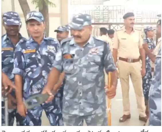
పైగా అభ్యర్థులు హాజరుకానున్నారు. ఎటువంటి అటంకాలు లేకుండా పరీక్షను సజావుగా నిర్వహించేందుకు విస్తృతమైన భద్రతా ఏర్పాటుచేసినట్లు అధికారులు వెల్లడించారు.

విశ్వంభర, నేషనల్ బ్యూరో: నీట్ యాజీ పునఃపరీక్ష కు కేంద్ర ప్రభుత్వం దేశవ్యాప్తంగా పరీక్ష సన్నాహాలు చేపట్టింది. పరీక్షను సజావుగా, సురక్షితంగా, పారదర్శకంగా నిర్వహించేందుకు శనివారం దేశవ్యాప్తంగా ఎగ్జామ్ సెంటర్ల వద్ద మాక్ డ్రైల్ నిర్వహిస్తోంది. రాత్రి 8 గంటల వరకు ఈ డ్రైల్ కొనసాగుతున్నట్లు అధికారులు వెల్లడించారు. పరీక్షా కేంద్రాల వద్ద సన్నద్ధతను పరీక్షించడం, ఈ ప్రక్రియలో పాల్గొనే అధికారుల మధ్య సమన్వయాన్ని మెరుగుపరచడం మాక్ డ్రైల్ ముఖ్య ఉద్దేశమని పేర్కొన్నారు. ఈ క్రమంలోనే దిల్లీలోనే నేషనల్ టెస్టింగ్ ఏజెన్సీ కార్యాలయం వద్ద భద్రతను కట్టుదిట్టం చేశారు. ఈ డ్రైల్లో భాగంగా పోలీసులు, పారామిలిటరీ దళాలతో సహా 2.5 లక్షలకు పైగా భద్రతా సిబ్బందిని 5,000కు పైగా పరీక్ష కేంద్రాల వద్ద మోహరించారు. నీట్ పునఃపరీక్ష జూన్ 21న మధ్యాహ్నం 2 గంటల నుంచి సాయంత్రం 5.15 గంటల వరకు 'పెన్-ఆన్-పేపర్' విధానంలో (అప్లైడ్ లైట్) జరగనుంది. దీనికి దేశంలోని 551 నగరాలు, విదేశాల్లోని 14 నగరాల్లో మొత్తం 22.79 లక్షల మందికి