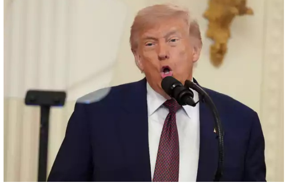
సంవత్సరం దేశాల కూటమి అయిన 'గ్రూప్ ఆఫ్ సెవెన్ (జీ7) 52వ శిఖరాగ్ర సదస్సు జరిపే ప్రాసెస్ లో జరిగింది.

విశ్వంభర, నేషనల్ బ్యూరో: ఫ్రాన్స్ లో జరిగిన జీ-7 సదస్సులో భాగంగా నేను బాన్ అంటూ అమెరికా అధ్యక్షుడు డొనాల్డ్ ట్రంప్ చేసిన వ్యాఖ్యలు వైరల్ అయ్యాయి. వాటిపై ఆయన తాజాగా స్పందించారు. ఆ మాట తాను ఫన్నీగా అంటే.. ప్రపంచమంతా పాకిందని అంతర్జాతీయ మీడియా సంస్థతో మాట్లాడుతూ వివరణ ఇచ్చారు. "జీ-7 సదస్సు లో భాగంగా మీరు వేదీక లోపలికి వచ్చి, ప్రపంచ నేతలందరి ముందు మిమ్మల్ని మీరు బాన్ గా అభివర్ణించుకున్నారు. ఎంతవంతు ఆ మాటను నమ్మి ఉంటారు" అని అధ్యక్షుడిని హాస్య ప్రశ్నించారు. "అందరూ నమ్ముతారు. కానీ నేను ఆ మాట అన్నది సరదాకే. వారంతా నాకు తెలిసినవారు, పలు దేశాల నాయకులు. లోపలికి వచ్చి వారిని చూసి, నేను బాన్ ను అని చెప్పాను. అదంతా జోకేగానే చెప్పాను. కానీ ఆ మాట ప్రపంచమంతా పాకింది. అది నేను నమ్మలేకపోతున్నాను. నేను అందరినీ నమ్మించాలనుకున్నాను. నేను పెచ్చనం చేయాలనుకోలేదు" అని ట్రంప్ క్లారిటీ ఇచ్చారు. కాగా..