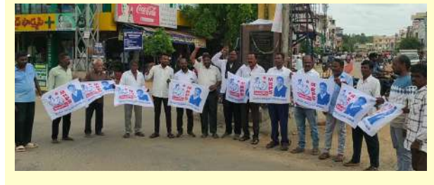
ఎస్సీ పధికరణ కోసం ఉద్యమం కొనసాగుతుంది..