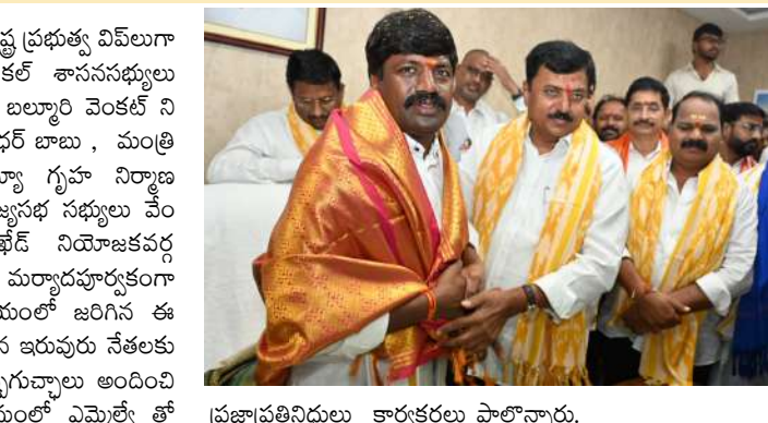
ప్రజాప్రతినిధులు కార్యకర్తలను పాల్గొన్నారు.