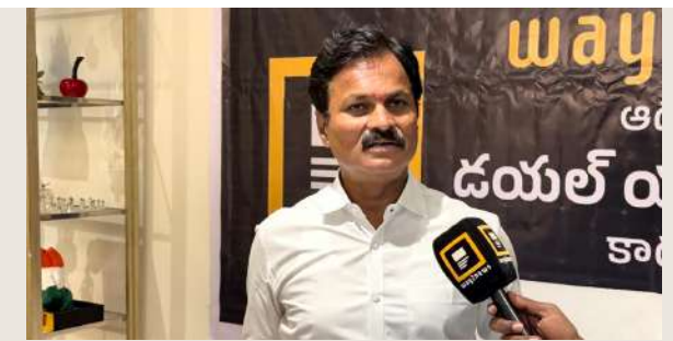
సమస్యల పరిష్కారంలో జాప్యం వద్దు: భువనగిరి ఎమ్మెల్యే