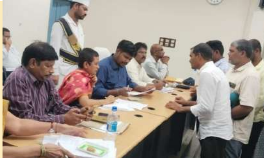
గిరిజన దర్బార్ లో వివేక సీకరణ..